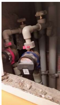
Uzávěr v bytě

Zastavit přívod vody v bytě na příslušné stoupačce.